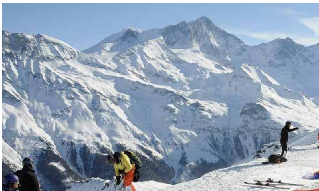
Les pilotes prendront leur envol de Sorebois, samedi et dimanche.

VBC SIERRE Présentation de l'équipe des juniors garçons. Une petite révolution dans le club sierrois.