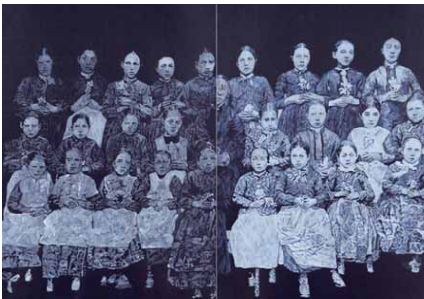
Une classe de filles vers 1890 à Chippis, une photographie «recopiée» et réinterprétée par Aline Seigne à l'espace Zone 30 Art Public.

Un retournement de situation qui interroge l'artiste, fascinée dans un premier temps par ces photographies historiques, mais qui, ensuite, n'est pas dupe de ce qu'elles véhiculent. «Je suis attirée par ces cli-