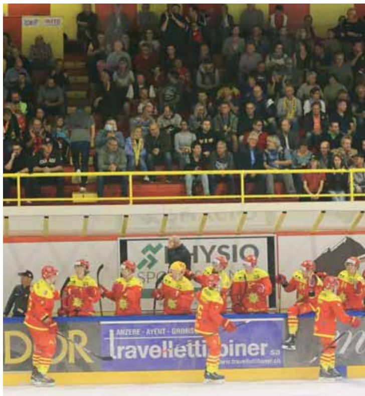
La foule des grands soirs face à Viège. Mais ce n'est pas toujours le cas. Le Covid va laisser un trou dans la trésorerie: moins de billets vendus les soirs de match et moins de monde aux cantines.