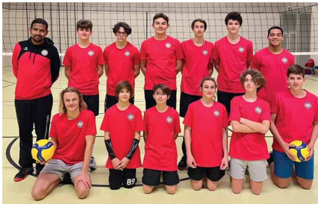
L'équipe des juniors garçons a débuté en championnat l'automne dernier.