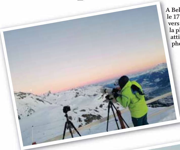
A Bella Lui, le 17 janvier vers 17 h 30, la pleine lune attire les photographes!