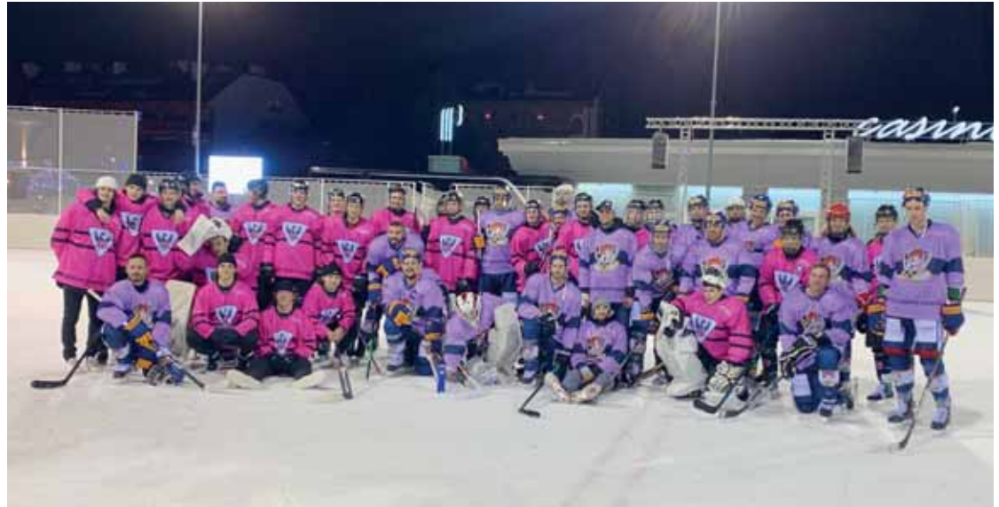
Le HC Crans-Montana et les U20 Elites fribourgeois, réunis avec le maillot spécialement créé pour leur rencontre caritative.