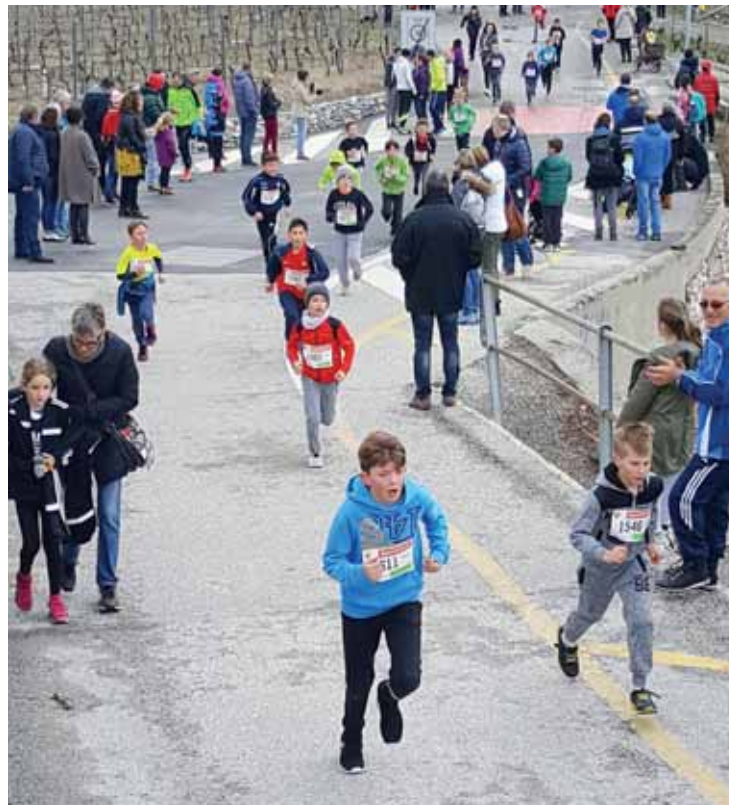
Pas de montée de Goubing cette année. Le parcours sera complètement plat du côté d'Ecossia. LE JDS

Le Challenge des Entreprises sera également reconduit pour