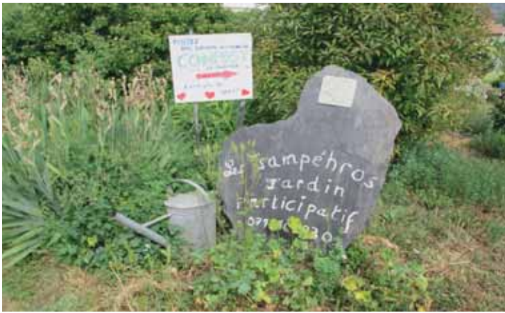
A l'entrée de Tsampéhros où l'on fait aussi du compost.