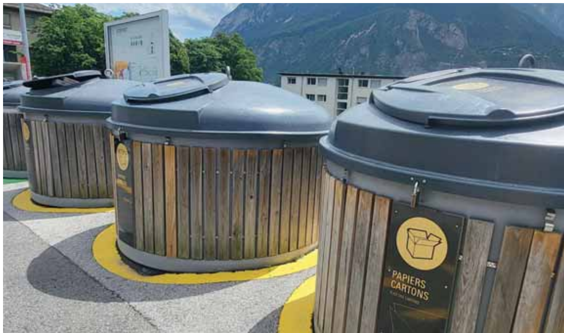
Les moloks à papier et carton sont de plus en plus nombreux dans les écopoints.

Le responsable environnement et biodiversité de la ville de Sierre aimerait faire passer un message concernant ces écopoints: «Les cartons doivent être conditionnés dans le molok. Ce n'est pas suffi-