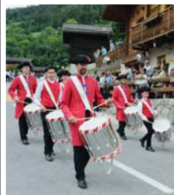
Les Fifres et tambours de Grimentz à St-Jean en 2018. REMO

GRIMENTZ Les Fifres et Tambours de Grimentz organisent la 51e édition du festival de l'Association des tambours et fifres du Valais romand (ATFVR) les 4 et 5 juin. C'est la troisième fois que la société de Grimentz organise la rencontre, elle qui a adhéré à l'association en 1986. Deux autres sociétés du district en font partie, celle de Sierre, membre fondateur et celle de Saint-Jean, membre depuis 1970. L'ATFVR, créée en 1969 regroupe douze sections, huit sociétés de fifres et tambours et quatre sociétés de tambours.