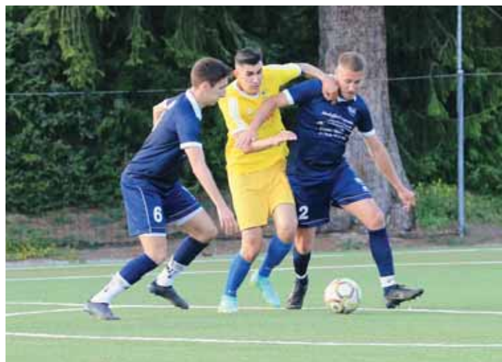
Le week-end dernier, Crans-Montana a battu Granges 5-1.