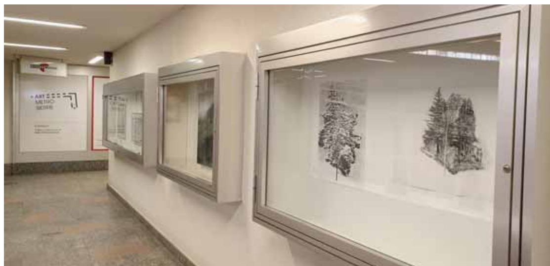
Les vitrines de la galerie Art Métro Sierre fête ses 5 ans!