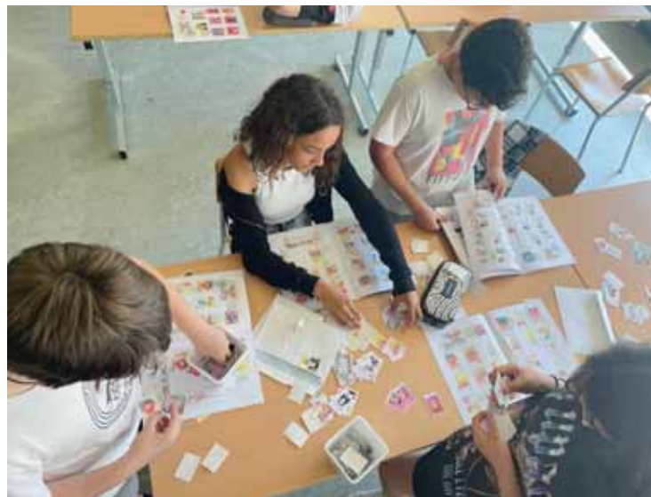
En classe ou à la récré, les élèves des écoles primaires de Sierre ont rempli leur album Sierrini, portraits de leurs petits camarades.